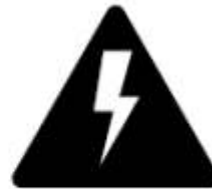
Consumo de Energia