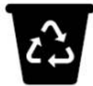
Gestão de Resíduos