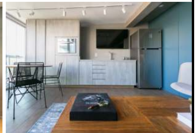
Residência no Home Boutique Cyrela | São Paulo - SP