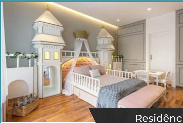
Residência no Condomínio Villa Solaia | Barueri - SP