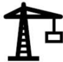
Gestão da Construção