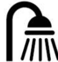
Consumo de Água